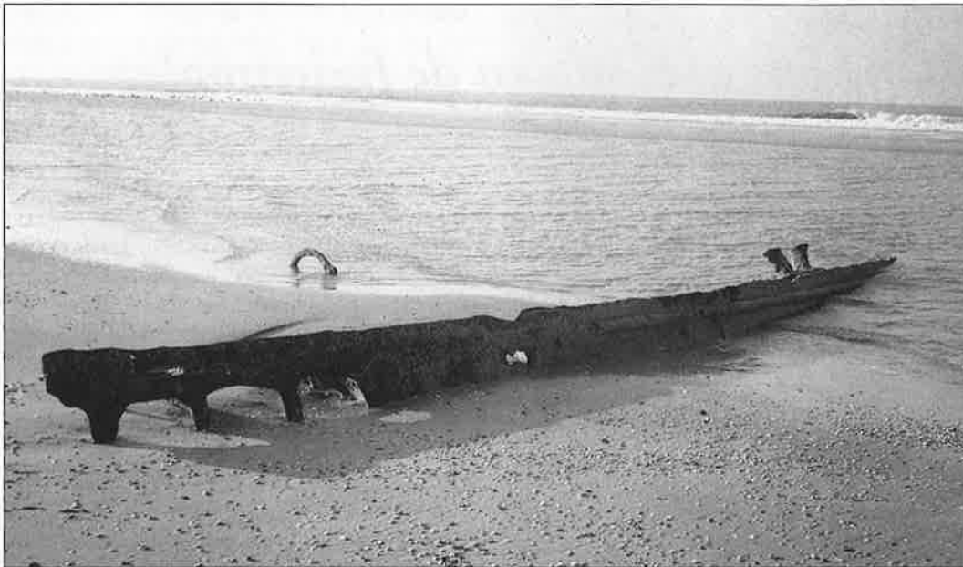
Een langwerpige en scherp stuk oud ijzer steekt sommige jaren boven het zand uit (januari 1988).

In De Spiegel van 23 december 1923 is evenwel te lezen dat de Heemskerk een 'zetje' heeft gekregen en anderhalve meter is opgeschoven. Dat lijkt er meer op. Van een vaargeul is in elk geval geen sprake. De bergers zijn volgens de krant Kennemerland allerm minst ontmoedigd door de mislukking. Ze kondigen meteen een nieuw plan aan, ook met springstof. Maar van nieuwe pogingen wordt verder niets meer vernomen.